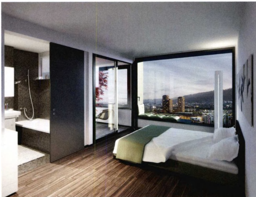
Die Wohnungen im Hochhaus sind für ein urbanes Publikum bestimmt. Keine gleicht der anderen.